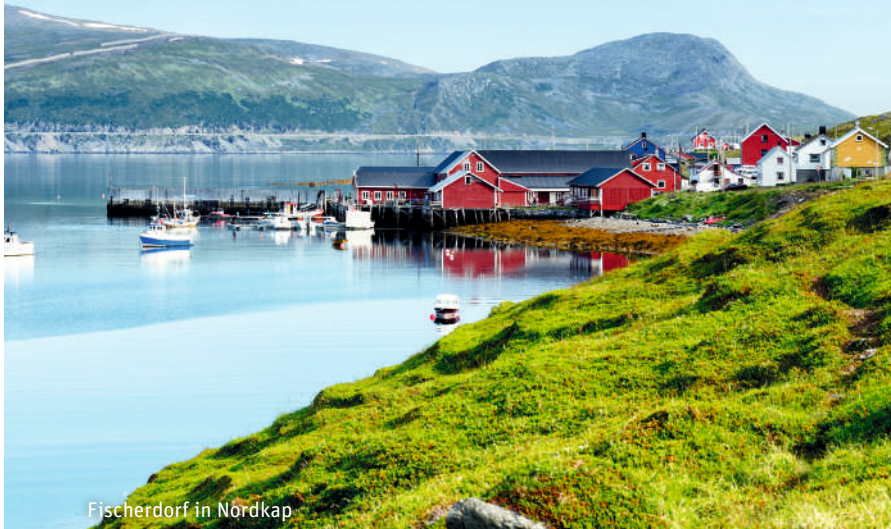
Fischerdorf in Nordkap