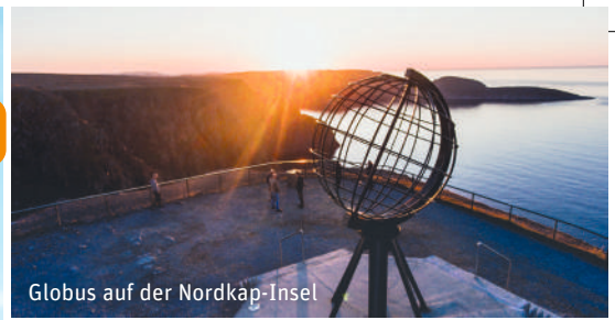
Globus auf der Nordkap-Insel