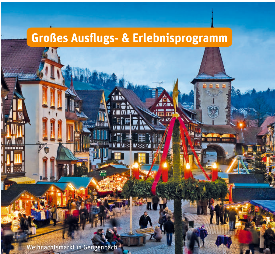
Weihnachtsmarkt in Gengenbach