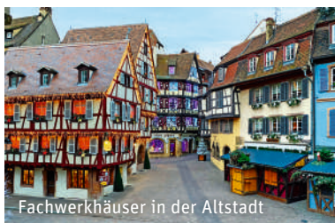
Fachwerkhäuser in der Altstadt

Generelle Hinweise: Die Kurtaxe in Oberharmersbach von ca. € 1,05–3,50 pro Person und Nacht ist vor Ort im Hotel zu entrichten. (Stand: April 2026). Mindestteilnehmerzahl: 36 Personen/Termin. Bei Nichterreichen kann die Reise bis 30 Tage vor Reisebeginn abgesagt werden. Reiseveranstalter: trendtours Touristik GmbH, Düsseldorf Str. 9, 65760 Eschborn