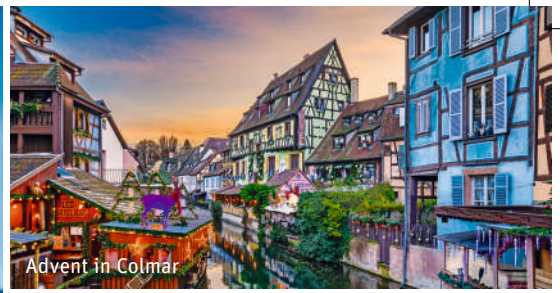
Advent in Colmar