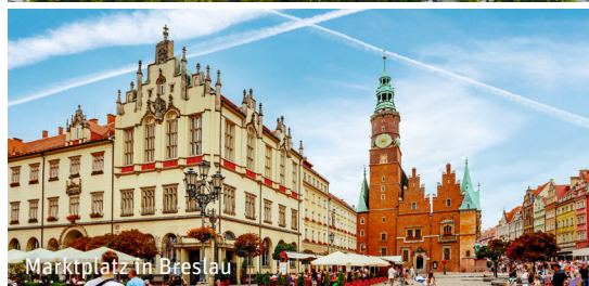
Marktplatz in Breslau