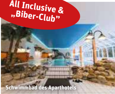
Schwimmbad des Aparthotels