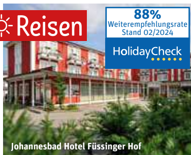
Johannesbad Hotel Füssinger Hof