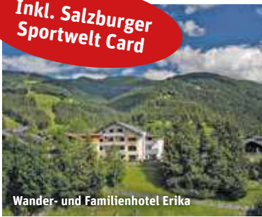
Wander- und Familienhotel Erika