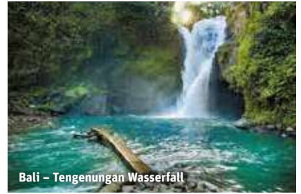
Bali – Tengenungan Wasserfall