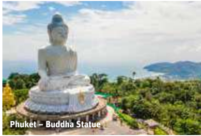
Phuket – Buddha Statue