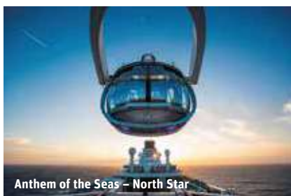
Anthem of the Seas – North Star