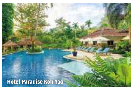
Hotel Paradise Koh Yao