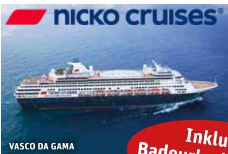
VASCO DA GAMA