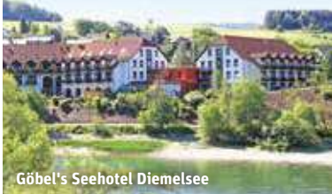
Göbel's Seehotel Diemelsee

88% Weiterempfehlungsrate Stand 02/2024 HolidayCheck ★★★★★