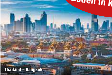
Thailand – Bangkok