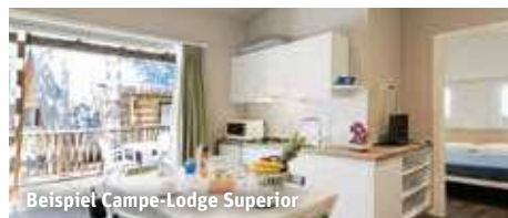
Beispiel Camp-Lodge Superior