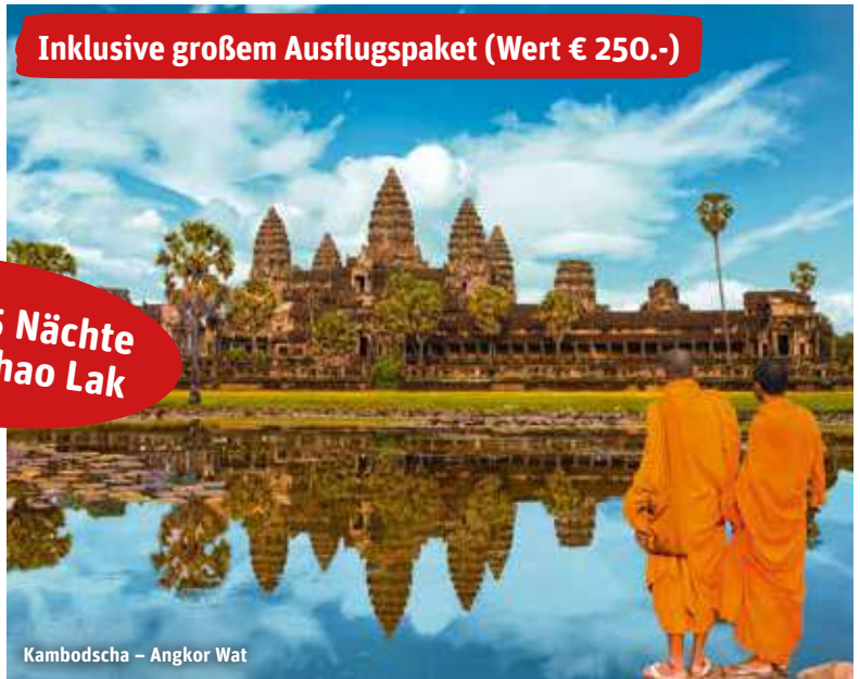
Kambodscha – Angkor Wat

Inklusive großem Ausflugspaket (Wert € 250.-)