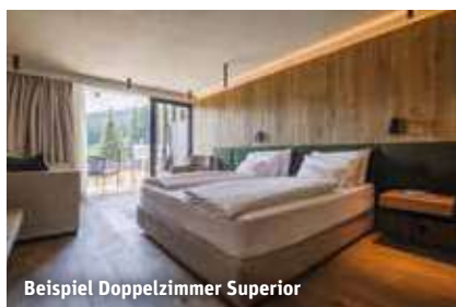
Beispiel Doppelzimmer Superior