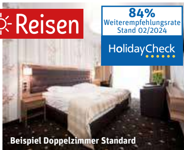
Beispiel Doppelzimmer Standard