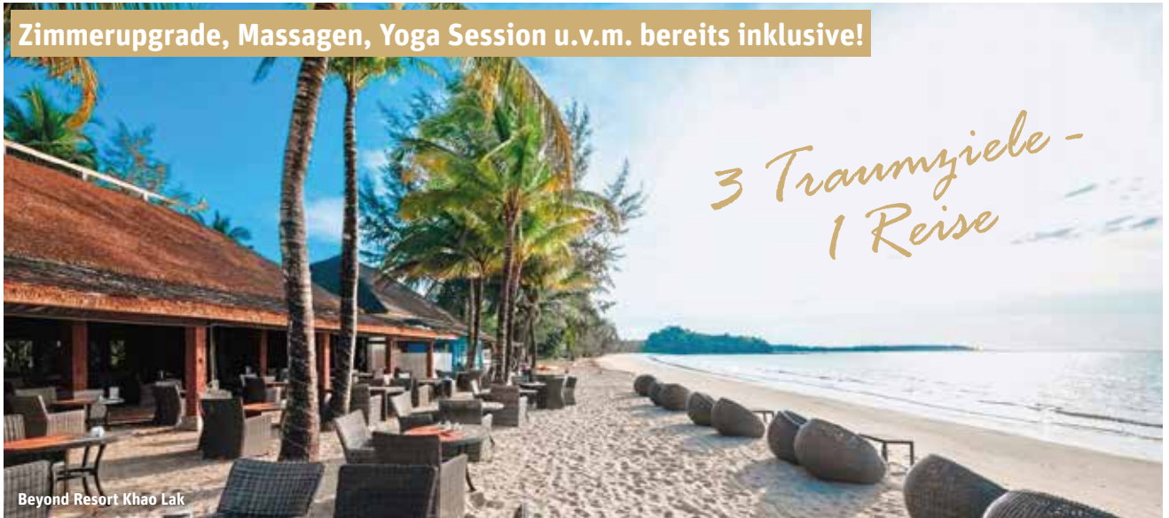
Beyond Resort Khao Lak