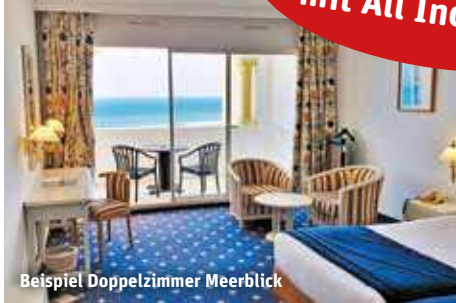
Beispiel Doppelzimmer Meerblick