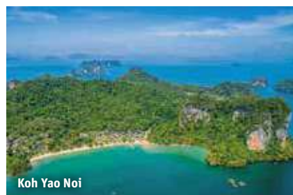
Koh Yao Noi

Koh Yao Noi – In traumhafter Lage, umgeben von Kalksteinklippen und tropischem Regenwald, erwartet Sie das 4-Sterne Hotel Paradise Koh Yao (Landeskät.) an der Nordspitze der Insel mit 400 m langem Privatstrand – der perfekte Ort für unvergessliche Spa-Anwendungen und Yoga unter Palmen. Zu den Annehmlichkeiten zählen Rezeption, kostenfreies WLAN, Boutique, 2 Restaurants, 2 Pools (Liegen/Schirme am Pool inklusive) sowie Pool- und Strandbar. Das Sport- und Freizeitangebot beinhaltet Beachvolleyball, Badminton, Themenabende mit Shows und Livemusik. Gegen Gebühr: Katamaran, Kajak, Tauchen, Yoga, Mountainbike-Verleih sowie Spa-Bereich mit Dampfbad, Massage- und Beautyanwendungen. Die Superior Studios (ca. 54 m 2 , min. 1/max. 2 Vollzahler) verfügen über ein halboffenes Bad (teilw. Außendusche), Föhn, Leihbademantel-/slipper, Klimaanlage, TV, Minibar, Kaffee-/Teezubereiter und Balkon oder Terrasse mit Garten- oder Bergblick.