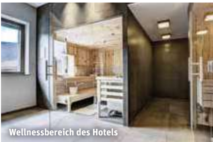
Wellnessbereich des Hotels