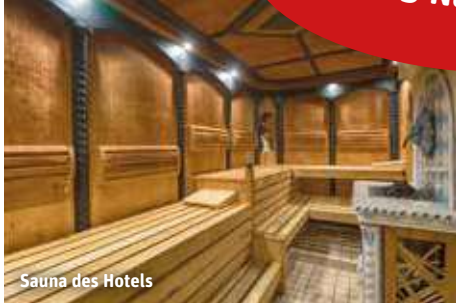
Sauna des Hotels