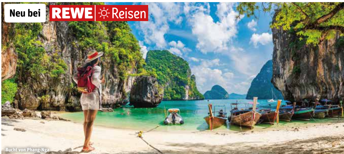
Bucht von Phang-Nga