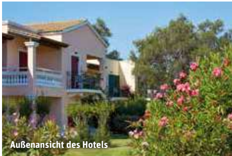
Außenansicht des Hotels