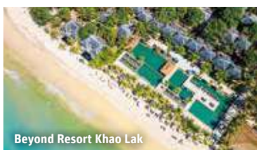
Beyond Resort Khao Lak

Khao Lak – Das 4-Sterne Beyond Resort Khao Lak (Landeskät.) bieten nicht nur mit seiner perfekten Lage am kilometerlangen Pakweep Beach eine unvergessliche Auszeit (Zentrum Khao Lak: ca. 15 km). Die sage und schreibe 2.000 m 2 große Poollandschaft mit 5 Pools (Liegen/Schirme am Pool inklusive) lässt gewiss keine Wünsche offen! Die Anlage bietet außerdem Rezeption, kostenfreies WLAN, Minimarkt, Fitnessraum, Whirlpool, 2 Restaurants, Swim-Up-Bar und Strandbar. Gegen Gebühr: Spa-Bereich mit Sauna, Massage- und Beautyanwendungen. Die Villen (ca. 61-70 m 2 , min. 1/max. 2 Vollzahler) verfügen über Dusche, Föhn, Klimaanlage, TV, Minibar (2 Flaschen Wasser pro Tag/Zimmer inklusive), Kaffee-/Teezubereiter und Terrasse mit Gartenblick.