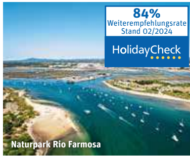
Naturpark Rio Formosa

84% Weiterempfehlungsrate Stand 02/2024 HolidayCheck