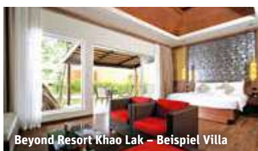
Beyond Resort Khao Lak – Beispiel Villa