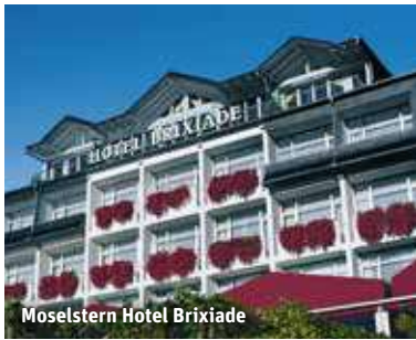
Moselstern Hotel Brixiade