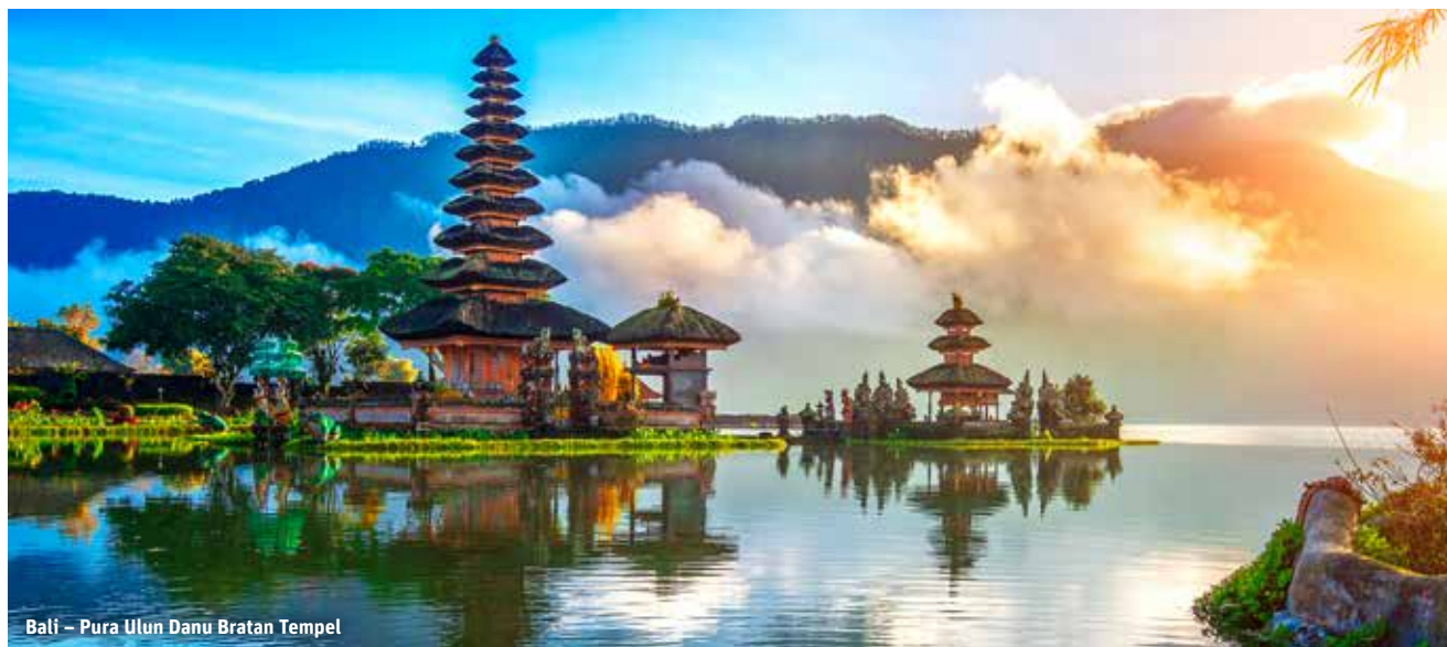
Bali – Pura Ulun Danu Bratan Tempel