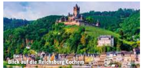
Blick auf die Reichsburg Cochem