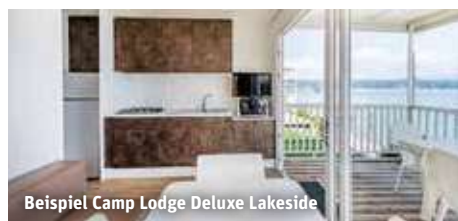
Beispiel Camp Lodge Deluxe Lakeside