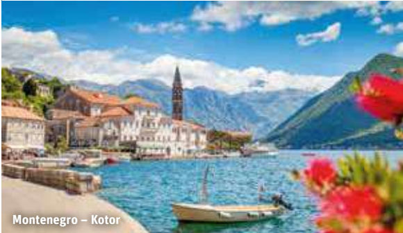
Montenegro – Kotor