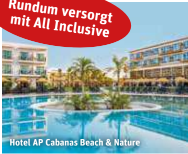
Hotel AP Cabanas Beach & Nature