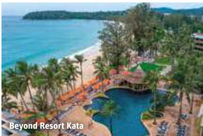
Beyond Resort Kata