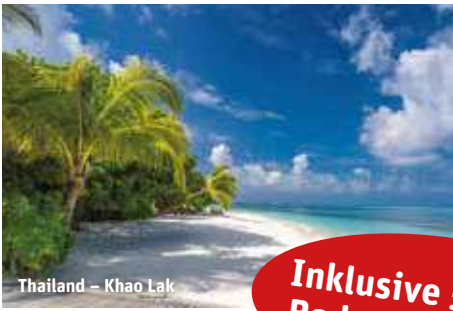
Thailand – Khao Lak