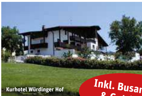
Kurhotel Würdinger Hof