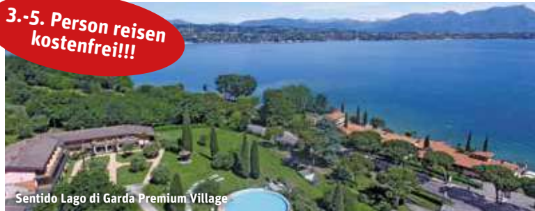
Sentido Lago di Garda Premium Village