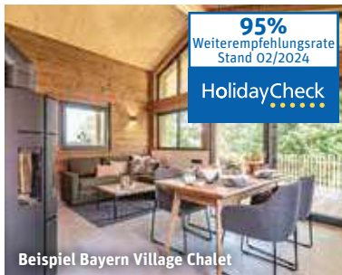
Beispiel Bayern Village Chalet

95% Weiterempfehlungsrate Stand 02/2024 HolidayCheck ★★★★★