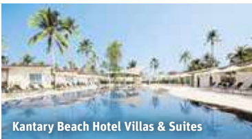
Kantary Beach Hotel Villas & Suites

Badeaufenthalt: Das 4-Sterne Kantary Beach Hotel Villas & Suites (Landeskät.) am Pakarang-Strand bietet kostenfreies WLAN, À-la-carte-Restaurants, Bars, Fitnessraum, Pool (Liegen inkl.) und Suiten (ca. 58 m², min. 1/ max. 2 Vollzahler) mit Bad, Föhn, Klimaanlage, Wohnbereich, integrierter Küchenette, Kühlschrank, TV, Safe, Balkon oder Terrasse mit Gartenblick.