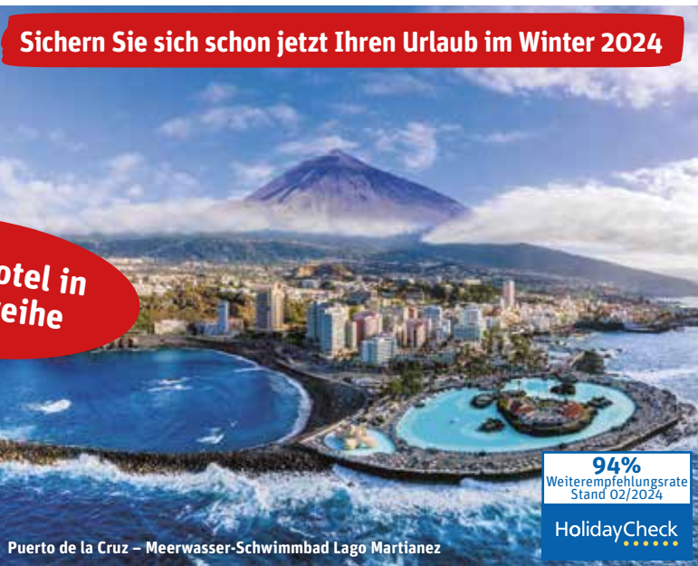
Puerto de la Cruz – Meerwasser-Schwimmbad Lago Martiánez

Sichern Sie sich schon jetzt Ihren Urlaub im Winter 2024