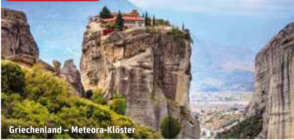
Griechenland – Meteora-Klöster