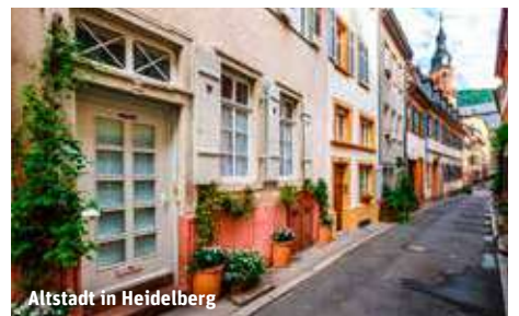
Altstadt in Heidelberg