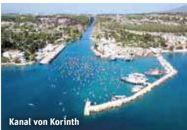
Kanal von Korinth

Alle Mittelklassehotels verfügen über Rezeption, Bar, Restaurant sowie Doppel- (2 Vollzahler) bzw. Einzelzimmer (1 Vollzahler) mit Bad oder Dusche, Klimaanlage und TV. Sie übernachten 3 x im Raum Kalamaki, 1 x im Raum Langadia, 2 x im Raum Itea und 1 x im Raum Karditsa.