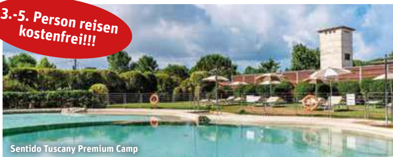
Sentido Tuscany Premium Camp