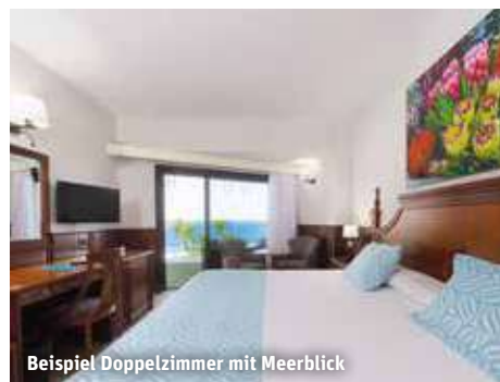
Beispiel Doppelzimmer mit Meerblick