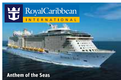
Anthem of the Seas