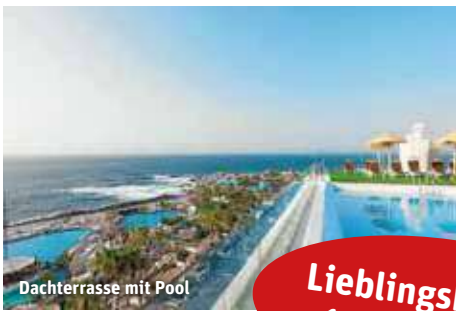
Dachterrasse mit Pool