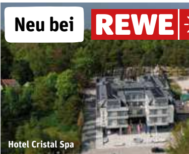
Hotel Cristal Spa

Kurtaxe ca. € 3,- p.P./Nacht (vor Ort zu zahlen). Ermäßigung für 1 Kind mit 2 Vollzahlern: bis Ende 6 Jahre 100%, und von 7 bis Ende 14 Jahren 50%