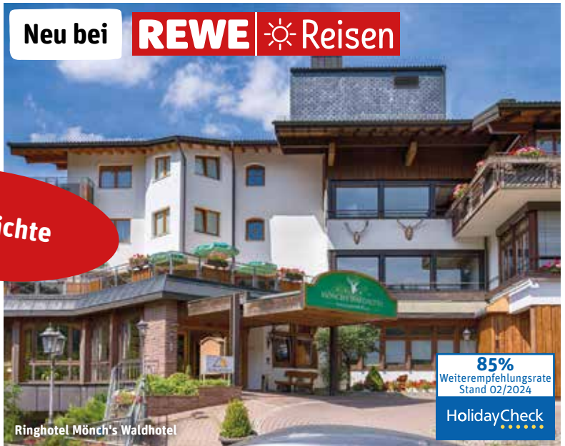
Ringhotel Mönch's Waldhotel