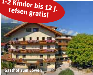
Gasthof zum Löwen