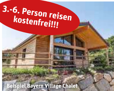
Beispiel Bayern Village Chalet