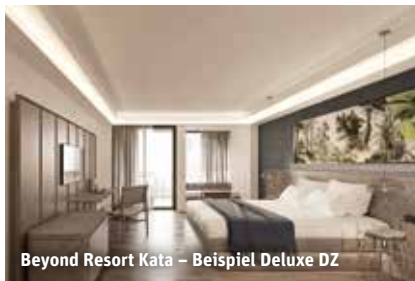
Beyond Resort Kata – Beispiel Deluxe DZ