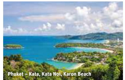
Phuket – Kata, Kata Noi, Karon Beach