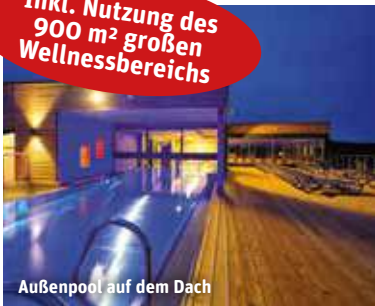
Außenpool auf dem Dach

Inkl. Nutzung des 900 m 2 großen Wellnessbereichs