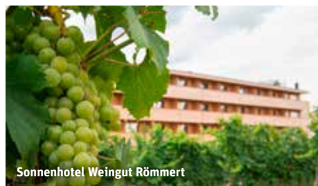
Sonnenhotel Weingut Römmert