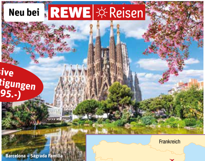
Barcelona – Sagrada Familia