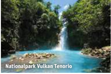
Nationalpark Vulkan Tenorio

Rundreise: Mittelklasse-Hotels oder Lodges mit Restaurant, Bar, Doppel- (2 Vollzahler) bzw. Einzelzimmer (1 Vollzahler) mit Bad oder Dusche. Badehotel: Das 3-Sterne Beispielhotel Sámara Beach (Landeskat.) in Playa Sámara liegt in Strandnähe und verfügt zusätzlich über einen Pool.