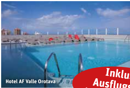
Hotel AF Valle Orotava