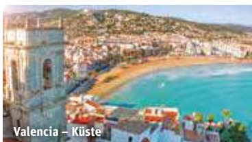
Valencia – Küste

Sie übernachten in 4-Sterne Hotels (Landeskat.) mit Rezeption, Restaurant, Bar und Doppel- (2 Vollzahler) bzw. Einzelzimmer (1 Vollzahler) mit Bad oder Dusche/WC.