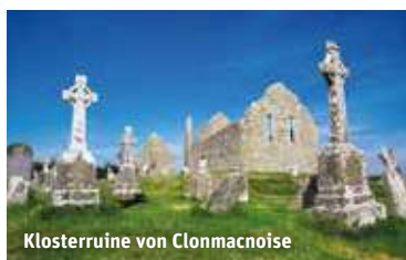
Klosterruine von Clonmacnoise

Generelle Hinweise: Mindestteilnehmer: 10 Personen (siehe Seite 2). Die Republik Irland gehört zur Europäischen Union, für die Einreise benötigen deutsche Staatsbürger lediglich einen Reisepass. Die Landeswährung ist der Euro. Die Hotelnamen erfahren Sie vor Ort. Detaillierte Infos zur dieser tollen Reise unter rewe-reisen.de