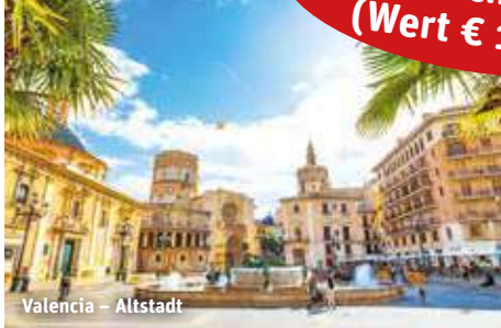
Valencia – Altstadt