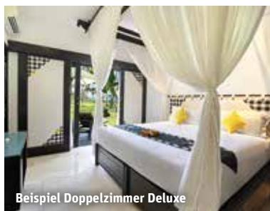
Beispiel Doppelzimmer Deluxe

Zimmer: Die modernen Doppelzimmer Deluxe (ca. 30 m 2 , min. 1 / max. 2 Vollzähler) sind in warmen Farben gehalten und verfügen über eine zeitgenössische balinesische Einrichtung, die das gemütliche Interieur ausmacht. Zur Ausstattung zählen Dusche, Föhn, Klimaanlage, TV, Safe, Minibar, Kaffee- und Teezubehör sowie Balkon oder Terrasse mit Gartenblick.