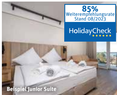
Beispiel Junior Suite

85% Weiterempfehlungsrate Stand 08/2023 HolidayCheck