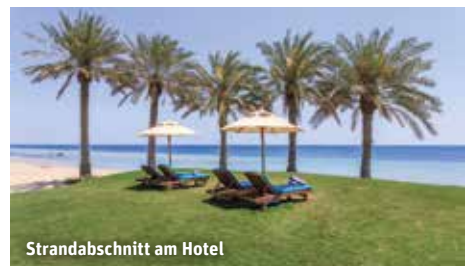
Strandabschnitt am Hotel