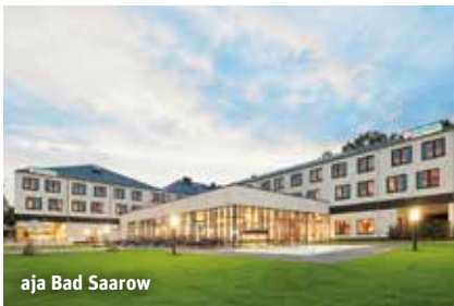
aja Bad Saarow