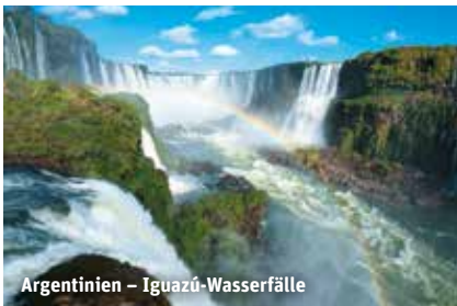
Argentinien – Iguazú-Wasserfälle