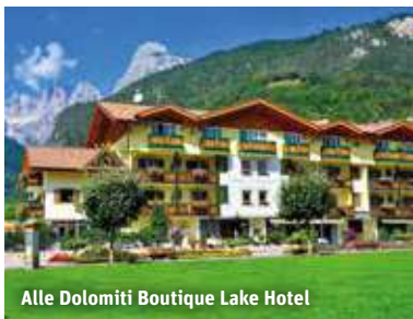
Alle Dolomiti Boutique Lake Hotel