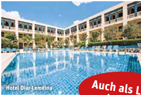
Hotel Diar Lemdina