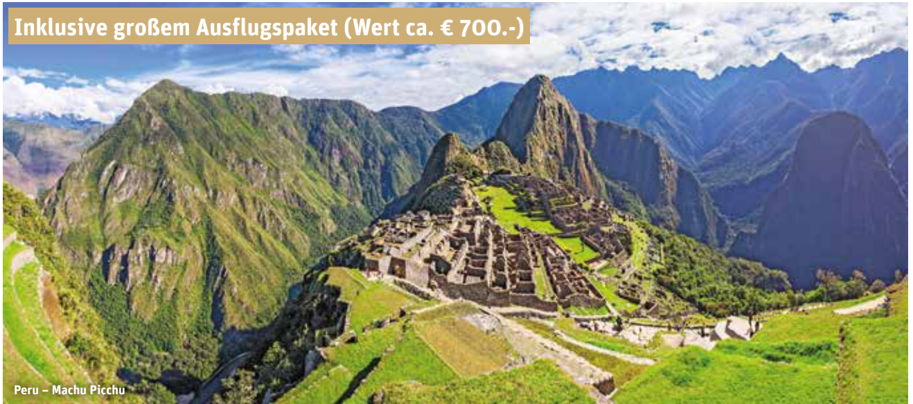
Peru – Machu Picchu

Inklusive großem Ausflugspaket (Wert ca. € 700.-)