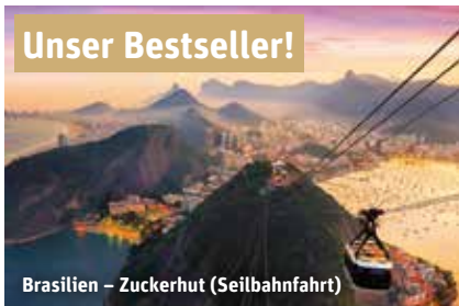
Brasilien – Zuckerhut (Seilbahnfahrt)