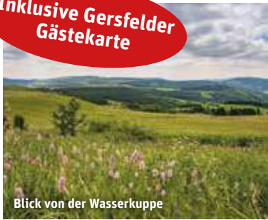
Blick von der Wasserkuppe