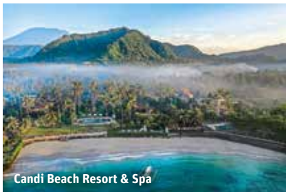
Candi Beach Resort & Spa

Candi Beach Resort & Spa – Infinity-Pool