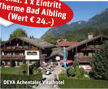
DEVA Achantaler Vitalhotel

Inkl. 1 x Eintritt Therme Bad Aibling (Wert € 24.-)