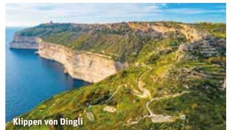
Klippen von Dingli