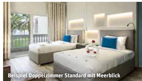
Beispiel Doppelzimmer Standard mit Meerblick