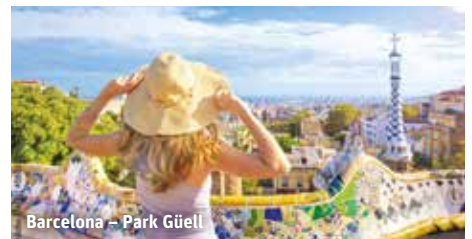
Barcelona – Park Güell