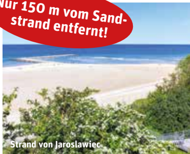
Strand von Jaroslawiec