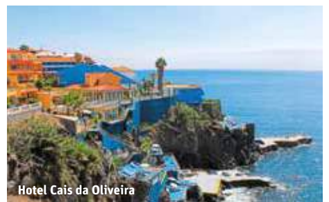
Hotel Cais da Oliveira