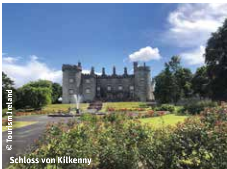
Schloss von Kilkenny