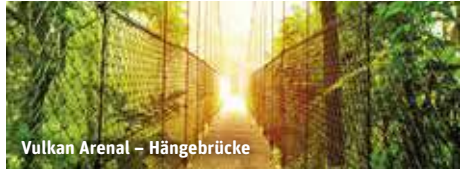
Vulkan Arenal – Hängebrücke