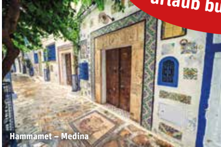
Hammamet - Medina