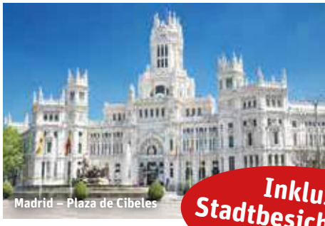
Madrid – Plaza de Cibeles