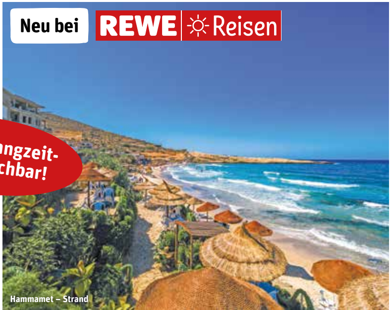
Hammamet - Strand