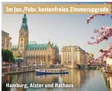
Im Jan./Febr. kostenfreies Zimmerupgrade