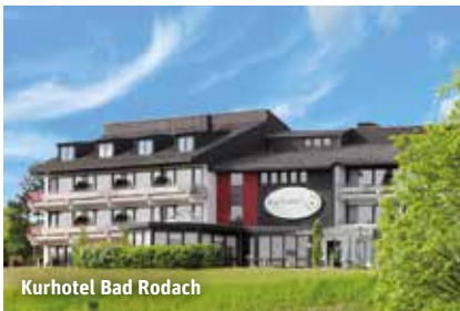
Kurhotel Bad Rodach

91% Weiterempfehlungsrate Stand 08/2023 HolidayCheck