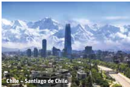
Chile – Santiago de Chile