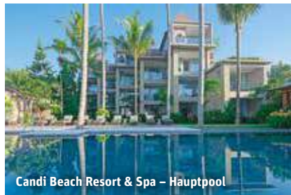
Candi Beach Resort & Spa – Hauptpool