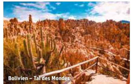
Bolivien – Tal des Mondes