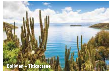
Bolivien – Titicacasee