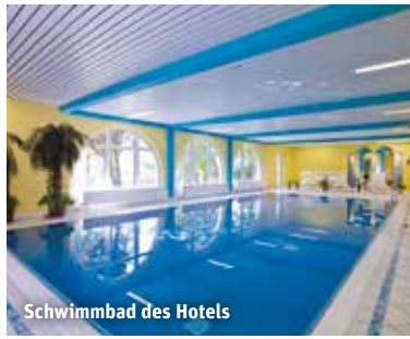
Schwimmbad des Hotels