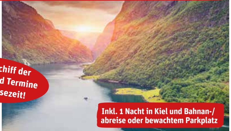
Nærøyfjord bei Flåm