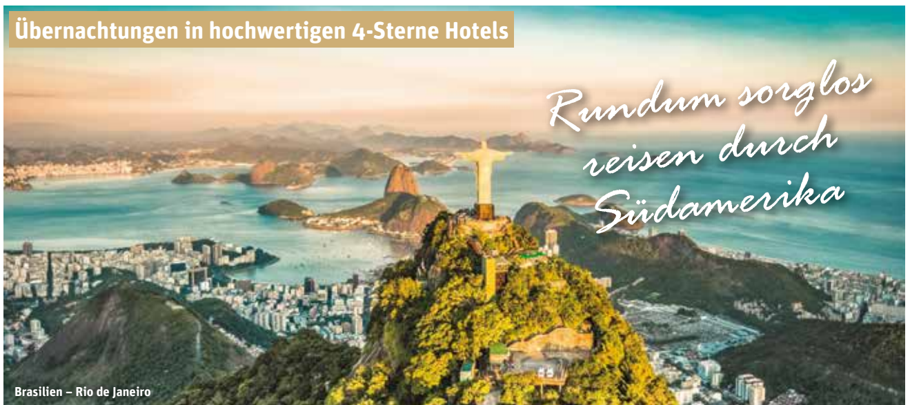
Brasilien – Rio de Janeiro