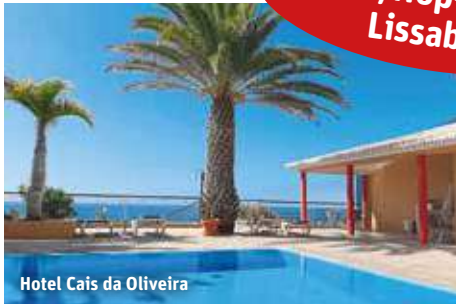
Hotel Cais da Oliveira