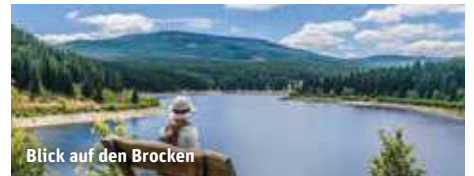
Blick auf den Brocken