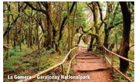
La Gomera - Garajonay Nationalpark