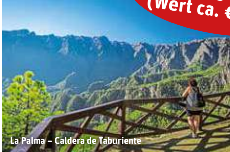
La Palma - Caldera de Taburiente