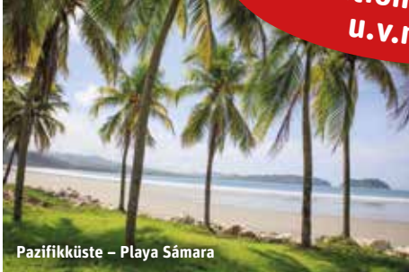
Pazifikküste – Playa Sámara

Inkl. Eintritt in 3 Nationalparks u.v.m.!