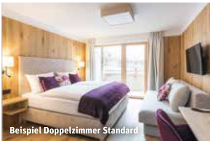
Beispiel Doppelzimmer Standard

97% Weiterempfehlungsrate Stand 08/2023 HolidayCheck