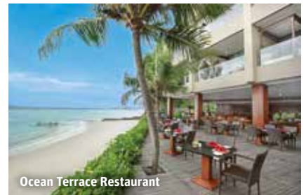
Ocean Terrace Restaurant